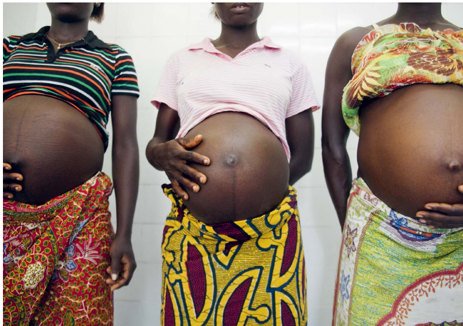
PREGLED OTROKA · Nosečnice v Slonokoščeni obali čakajo v vrsti na zdravstveni pregled.

“Leta 2020 je 2,4 milijona otrok umrlo v prvem mesecu po rojstvu. Veliko teh smrti bi bilo mogoče preprečiti,” pravi Mozziyar Etemadi, raziskovalec z Univerze North Western v Chicagu, ki se ukvarja z razvojem ultrazvočnega skenerja z vgrajeno umetno inteligenco, ki predvidi morebitne zaplete med nosečnostjo.