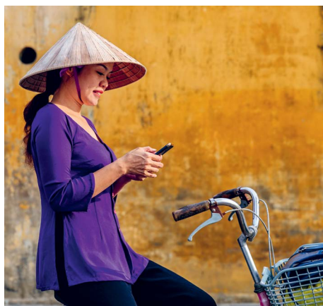
POVEZOVANJE · Sodobna tehnologija spreminja življenje mnogih. · Foto: hadynyah

D o roka za uresničenje ciljev trajnostnega razvoja, ki naj bi bili doseženi do leta 2030, je prehojena že več kot polovica poti. Toda kako so stvari napredovale, odkar so bili ti cilji sprejeti? V novem obsežnem Globalnem poročilu o trajnostnem razvoju 2023 skupina strokovnjakov ocenjuje stanje. Poročilo kaže, da se je napredek v zadnjih letih upočasnil, saj je bil le pri šestih od 17 ciljev dosežen zmeren napredek. Za to je delno kriva pandemija covid-19, vendar je bil tudi pred tem napredek prepočasen. Vseeno pa smo od leta 2015 dosegli napredek. Veliko več ljudi je dobilo dostop do osnovnih dobrin, kot so elektrika, neoporečna voda, mobilni telefon in lasten bančni račun. Tudi vmesni cilj, da se do leta 2030 reši življenje še več majhnih otrok, je še vedno na dobri poti, da bo dosežen.