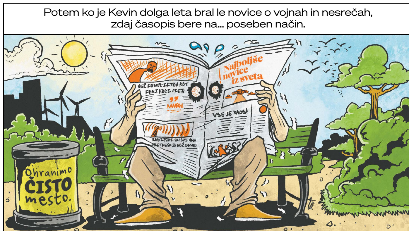
Ilustracija: Lauge Eilsøe-Madsen

Izdaja SLOGA, Platforma nevladnih organizacij za razvoj, globalno učenje in humanitarno pomoč. Slovenska inačica je nastala v sklopu projekta Trajnostno. Lokalno. Globalno. II, ki ga financira Ministrstvo za zunanje in evropske zadeve RS. Časopis izraža mnenja avtorjev in ne predstavlja uradnega stališča Vlade republike Slovenije.