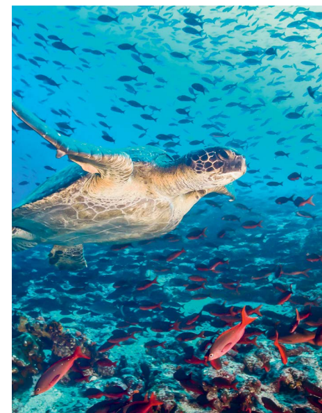
OHRANJEN ŽIVLJENJSKI PROSTOR · Morske želve so med živalmi, ki jim bo bolj okrepljeno varstvo morja koristilo. Fotografija te želve je bila posneta na otočju Galápagos

Eno od območij, kjer je učinek varstva morja očiten, je ocean ob obali Havajev. Tu so ZDA leta 2006 vzpostavile velikansko morsko zavarovano območje, 74-krat večje od Slovenije. Namen je bil zaščititi naravo znotraj tega območja, ven-