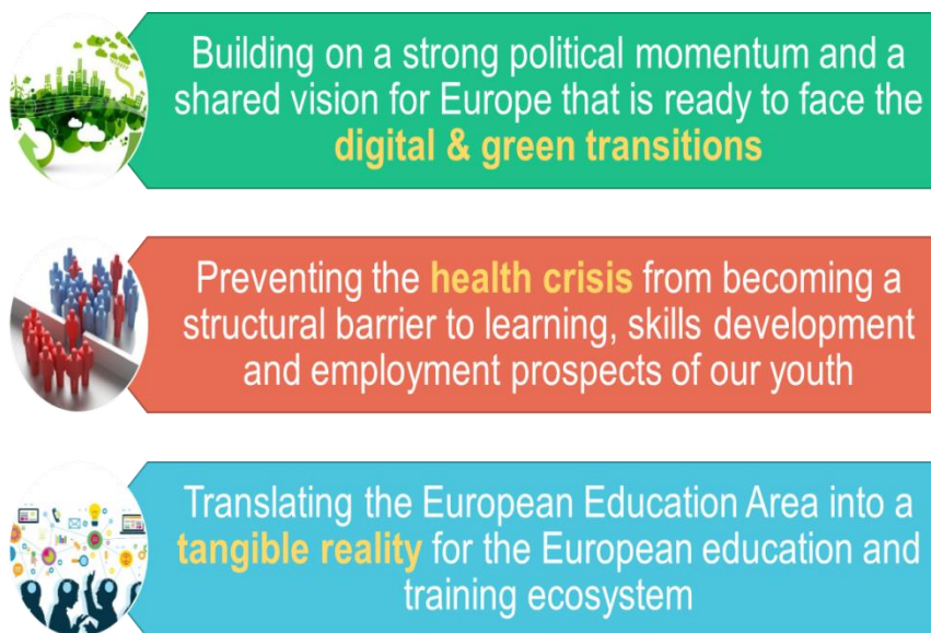
Slika: Vzpostavitev evropskega izobraževalnega prostora

Nov akcijski načrt za digitalno izobraževanje 13 podpira razvoj digitalnih tehnologij, ki so potrebne za izobraževanje in usposabljanje, ter vsem državljanom omogoča, da se opremijo z digitalnimi kompetencami. Komisija je avgusta 2021 pripravila predlog priporočila Sveta o kombiniranem učenju , da se z dodatnimi priložnostmi za učenje in ciljno podporo učencem, ki imajo težave pri učenju, zagotovi boljša podpora šolam in učencem, ki jih je v pandemiji med drugim prizadel tudi digitalni prehod 14 .